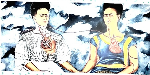
Las dos Fridas. Una de sus obras más populares. 1939.