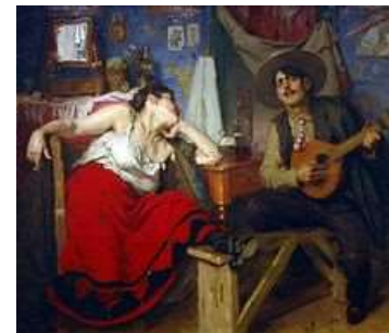
Painel do Fado, painted by José Malhoa.

The fadista sings the suffering, the longing for times past, the longing for a lost love, tragedy, misery, fate and destiny, pain, love and jealousy,