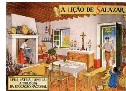
Advertising poster of Salazar regime.