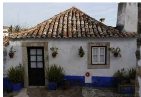
Typical house in a rural area - south of Portugal.